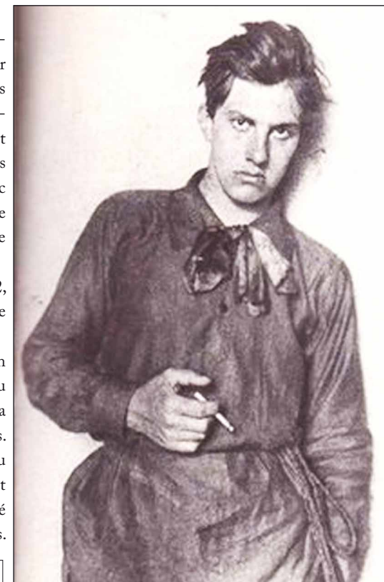
Blaise Cendrars, 16 ans, 1903.

Cendrars était un homme aux multiples talents. En France, il a été un auteur respecté déjà de son vivant ; il a été journaliste, assistant d'Abel Gance, pionnier du cinéma, et il s'est même essayé au métier d'apiculteur. Durant la Première Guerre mondiale, il a combattu aux côtés de la France, sa patrie culturelle d'élection, et il y a perdu son bras droit alors qu'il n'avait pas même vingt-huit ans. Il a été obligé par la suite d'apprendre à écrire de la main gauche. De 1924 à 1928, il s'est rendu plusieurs fois au Brésil, son « pays d'utopie » qu'il a qualifié de deuxième patrie d'élection. Durant la Seconde Guerre mondiale, il s'est retiré à Aix-en-Provence. Ce n'est qu'en 1950 qu'il est retourné à Paris où il est décédé en 1961, peu après avoir obtenu le Grand Prix littéraire de la Ville de Paris.